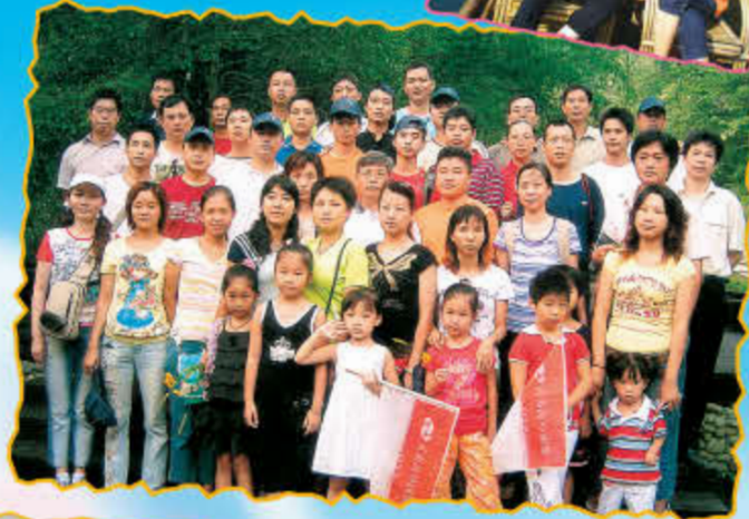
2006年10月21-22日, FQCT财务人员游览了美丽的厦门