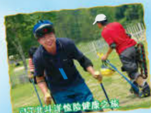
福州北斗洋休闲健康之旅

徜徉在青山绿水间,观赏不逊于“飞流直下三千尺”的“倚天瀑布”,欣赏景区内的怪石嶙峋、挺拔的古树以及挂满大树的千年古藤,感受惊险刺激的滑草、攀岩运动带来的惊心动魄。一天的活动在充实中度过。